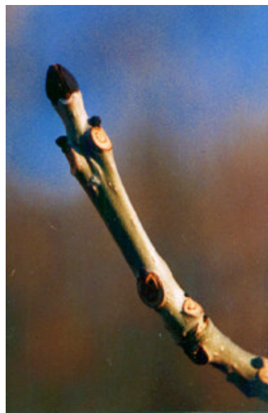
TSS - 200302#04 Ask