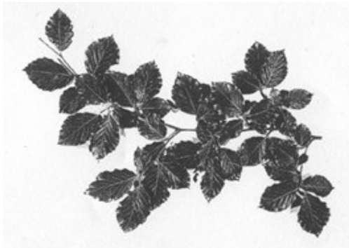
Bøgeblade danner mosaik ved at bladene på skuddene sidder i parallelle rækker (Oxlade: Journal of Biological Education; 1998)

De typiske skygge træer - bøg, ahorn, lind og hestekastanie - udnytter lyset maksimalt ved at arrangere bladene i mosaik.