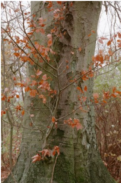
TSS - 200110#01

Unge planter og nye lavtsiddende skud på ældre stammer beholder ofte de visne blade om vinteren.