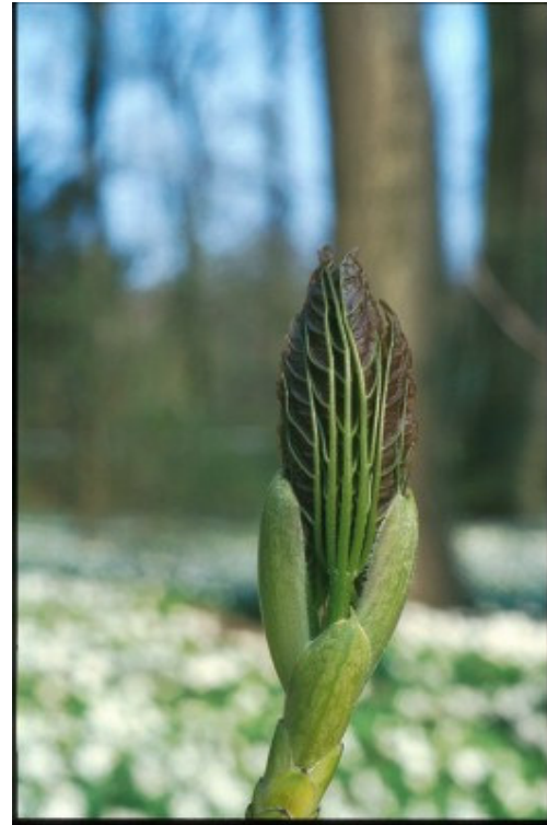
TSS - 199904#05 Ahornknop i udspring i april