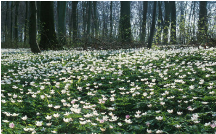
TSS - 199904#02. Anemonetæppe. Lisbjerg Skov; april 1999

Alle forårsplanterne har forrådsorganer i form af knold eller løg eller jordstængel, således at de hurtigt kan sætte skud. Der er et betydningsfuldt samarbejde mellem forårsplanterne og træerne i skoven om at gøre næringssstoffkredsløb så lukkede som muligt (se nedenfor). Mange har gule blomster med nektar eller pollen for at kunne tiltrække insekter; men bestøvningen svigter ofte fordi insekterne ikke er så tidligt fremme, således at planterne må ty til ukønnet formering - fx yngleknopper i bladhjørnerne hos vorterod.