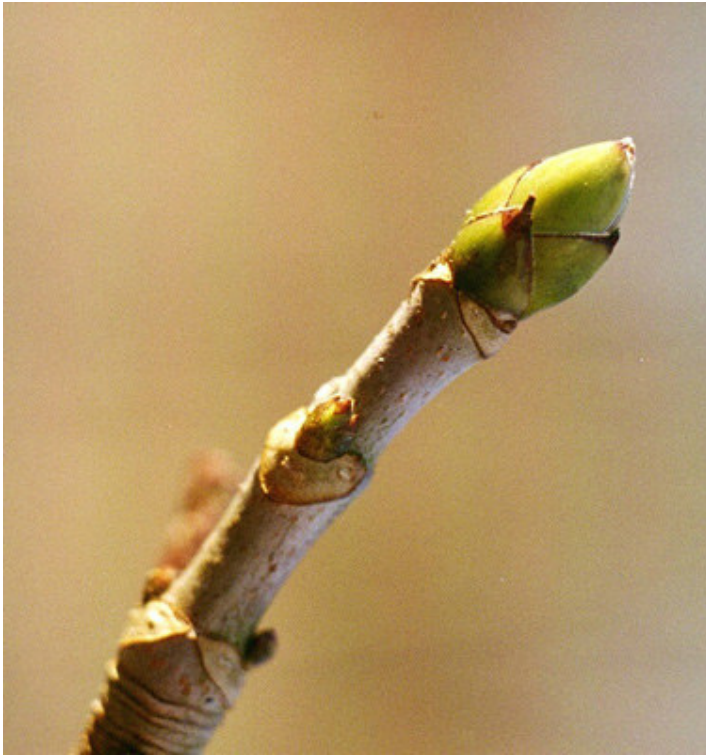
TSS - 200302#03 Ahornknop på spring i februar