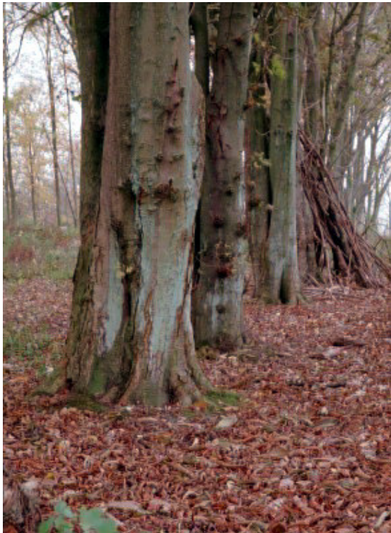
TSS - 200010#10

Løvtræerne stilles overfor flere svære udfordringer i løbet af vinteren - lave temperaturer, ringe lysmængde og - den vigtigste: risiko for udtørring på grund af den frosne jord. Træernes tilpasning til problemerne er at fælde bladene og gå i vinterhvile, når den aftagende lysmængde i efteråret signalerer, at året er ved at være slut.