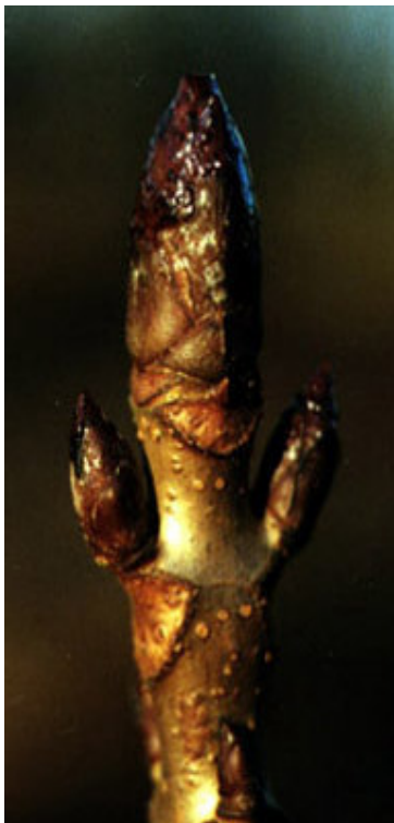
TSS - 200105#08 Hestekastanie

Knopudviklingen og forberedelserne til vinterhvilen er kontrolleret af de samme hormoner som ovenfor.