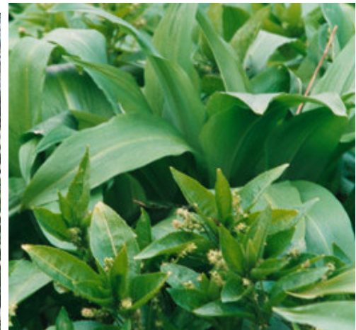
TSS - 200204#09. Bingelurt og ramsløg. Vestereng Skov; april 2002