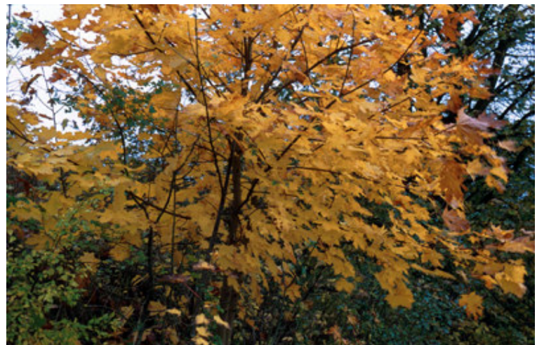
TSS - 199810#23